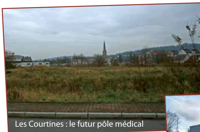
Les Courtines : le futur pôle médical