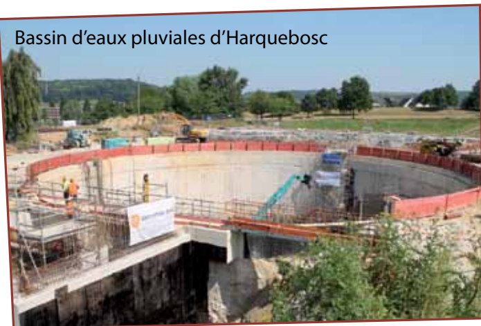
Bassin d'eaux pluviales d'Harquebosc