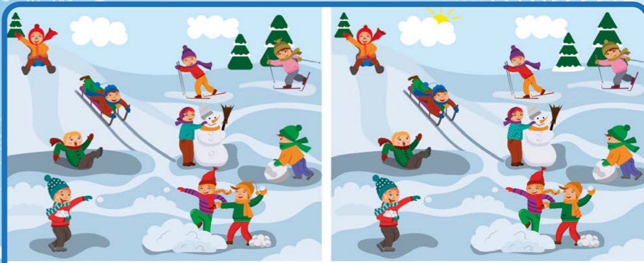
3 - Trouve les 20 différences Trouve les différences entre ces deux scènes