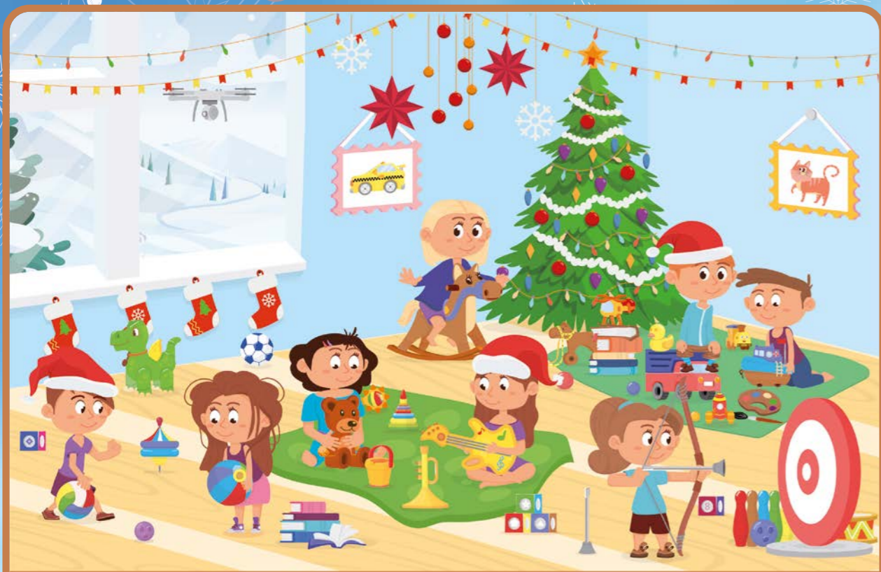
1 - Les 10 objets cachés Trouve ces objets dans l'image