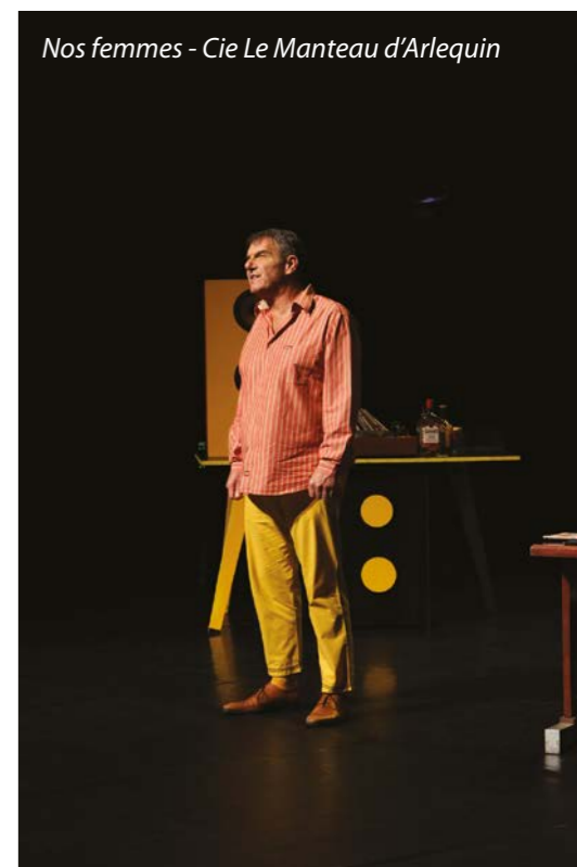
Nos femmes - Cie Le Manteau d'Arlequin