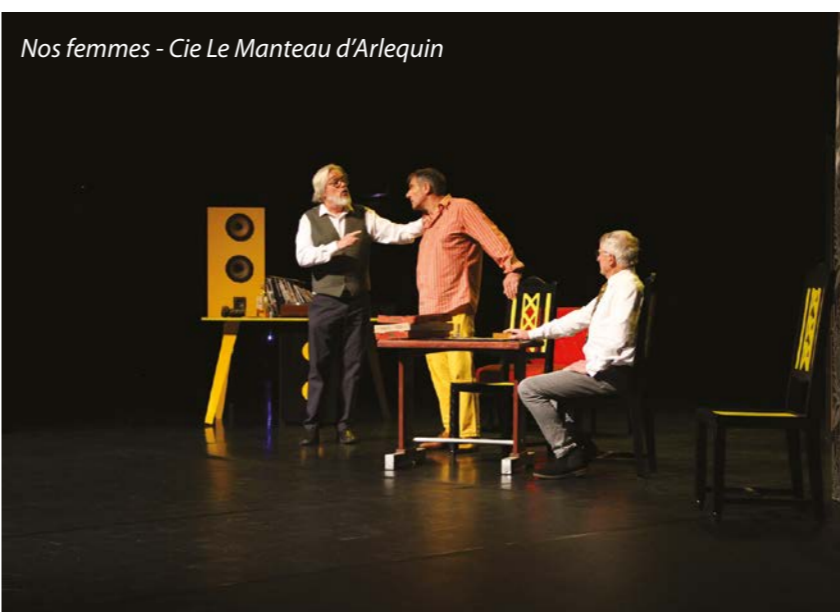
Nos femmes - Cie Le Manteau d'Arlequin

Le festival de théâtre Harfleurais reprend du service en 2023 avec une programmation variée et engagée. A l'heure où nous écrivons ces lignes deux pièces se sont jouées pour lesquelles le public a répondu présent en remplissant le Creuset de La Forge d'émotions et d'applaudissements. Gageons qu'il en sera de même pour les deux pièces à venir les 2 et 4 février 2023 : «Trop de silence en corps» par la compagnie du Temps qui sèche, traitant des violences faites aux femmes, et «L' auberge du Caramel», de et par la compagnie des «Tréteaux de juillet» dans un registre comique et déjanté pour clôturer cette édition. Nous reviendrons bien sûr sur ces deux derniers spectacles dans le prochain du numéro du Zoom.