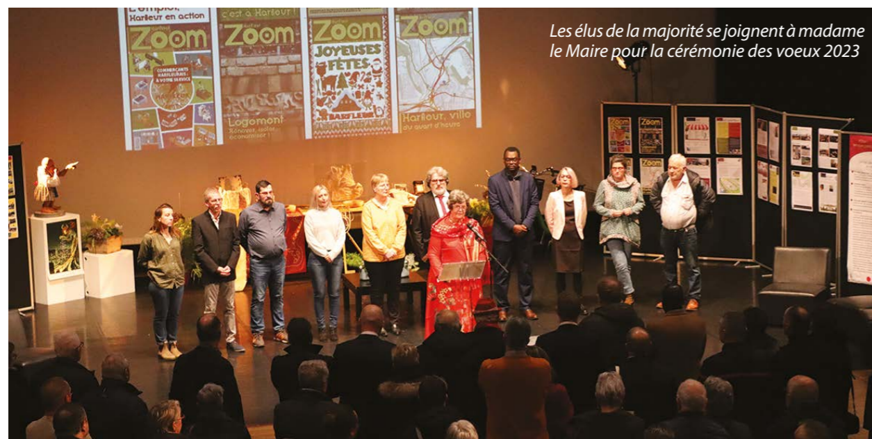
Les élus de la majorité se joignent à madame le Maire pour la cérémonie des vœux 2023