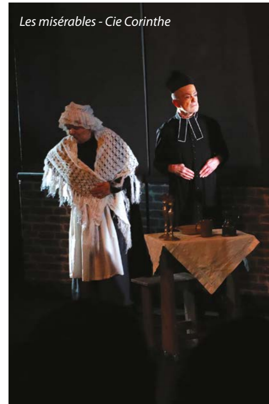
Les misérables - Cie Corinthe

Le festival de théâtre Harfleurais reprend du service en 2023 avec une programmation variée et engagée. A l'heure où nous écrivons ces lignes deux pièces se sont jouées pour lesquelles le public a répondu présent en remplissant le Creuset de La Forge d'émotions et d'applaudissements. Gageons qu'il en sera de même pour les deux pièces à venir les 2 et 4 février 2023 : «Trop de silence en corps» par la compagnie du Temps qui sèche, traitant des violences faites aux femmes, et «L' auberge du Caramel», de et par la compagnie des «Tréteaux de juillet» dans un registre comique et déjanté pour clôturer cette édition. Nous reviendrons bien sûr sur ces deux derniers spectacles dans le prochain du numéro du Zoom.