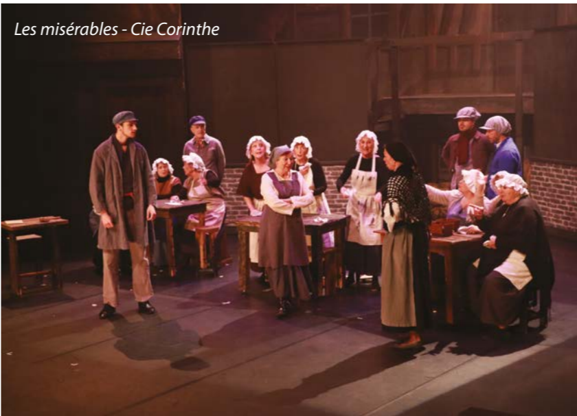
Les misérables - Cie Corinthe