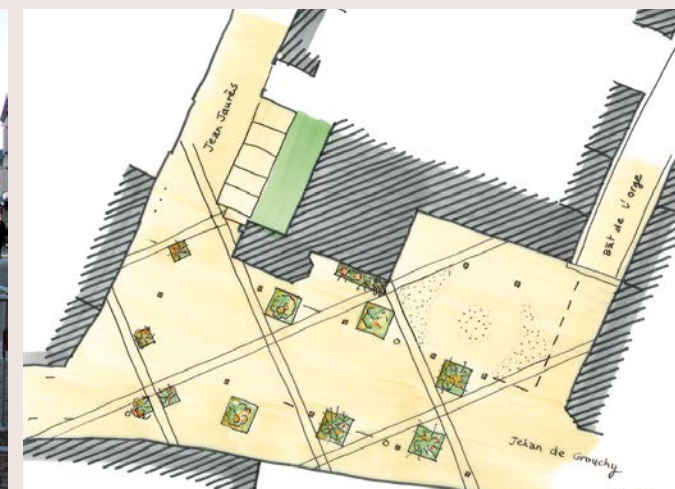
Croquis général de l'aménagement