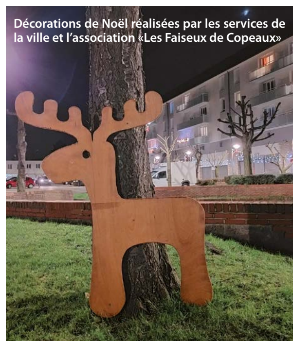
Décorations de Noël réalisées par les services de la ville et l'association «Les Faiseux de Copeaux»

C'est un des objectifs qu'on s'est fixé au niveau de la Municipalité. Chaque année, nous multiplions les décorations avec des matériaux recyclables de type bois, avec des objets de récupération. On favorise également les décorations de jours et on tente de diminuer les décorations lumineuses. On peut aussi consommer localement, ce qui permet de diminuer ce qu'on appelle « l'impact » carbone de ce que l'on consomme. Mais le mieux est peut-être que je vous laisse découvrir ce qu'il y a dans le dossier ou encore que vous nous fassiez part de vos idées.