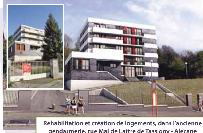
Réhabilitation et création de logements, dans l'ancienne gendarmerie, rue Mal de Lattre de Tassigny - Alcéane