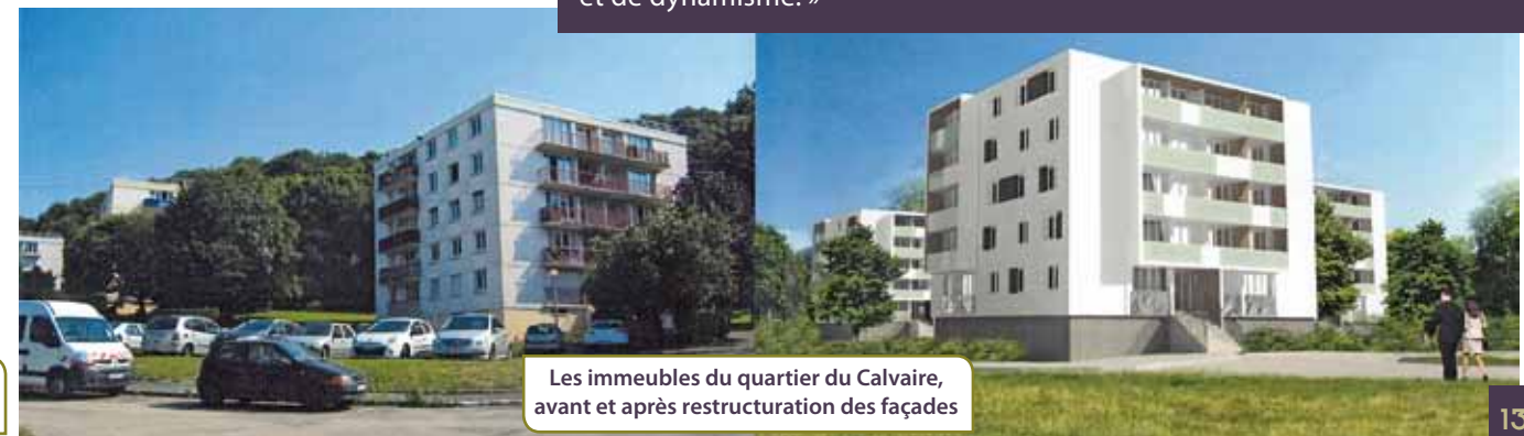
Les immeubles du quartier du Calvaire, avant et après restructuration des façades