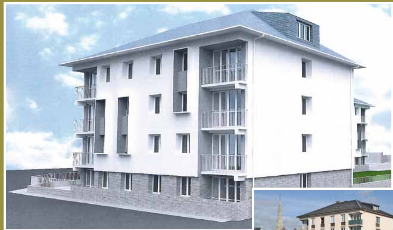
Les projets de rénovation 2018