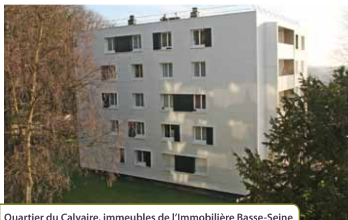
Quartier du Calvaire, immeubles de l'Immobilier Basse-Seine

du Territoire de la Pointe de Caux chez Habitat 76. Néanmoins, ces augmentations seront compensées par une baisse de 42 % des charges de chauffage, ce qui aboutit à une baisse globale de la facture du logement (Loyer + chauffage) de -1€ à -5€ pour l'ensemble des locataires. Telle est la base sur laquelle nous avons consulté les locataires lors de réunions d'information auxquelles ils ont été invités par courrier nominatif. Sur les 43 % de votants, nous avons reçu 90% d'avis favorables. Mais ces estimations seront respectées à deux conditions : que le coût de l'énergie soit constant et que les locataires acceptent d'être chauffés à 19 degrés ». Enfin, la Municipalité a été particulièrement attentive à la qualité architecturale des bâtiments. Les nouveaux revêtements choisis rappellent ainsi la pierre de taille apparente d'origine qui est désormais masquée par le complexe isolant.