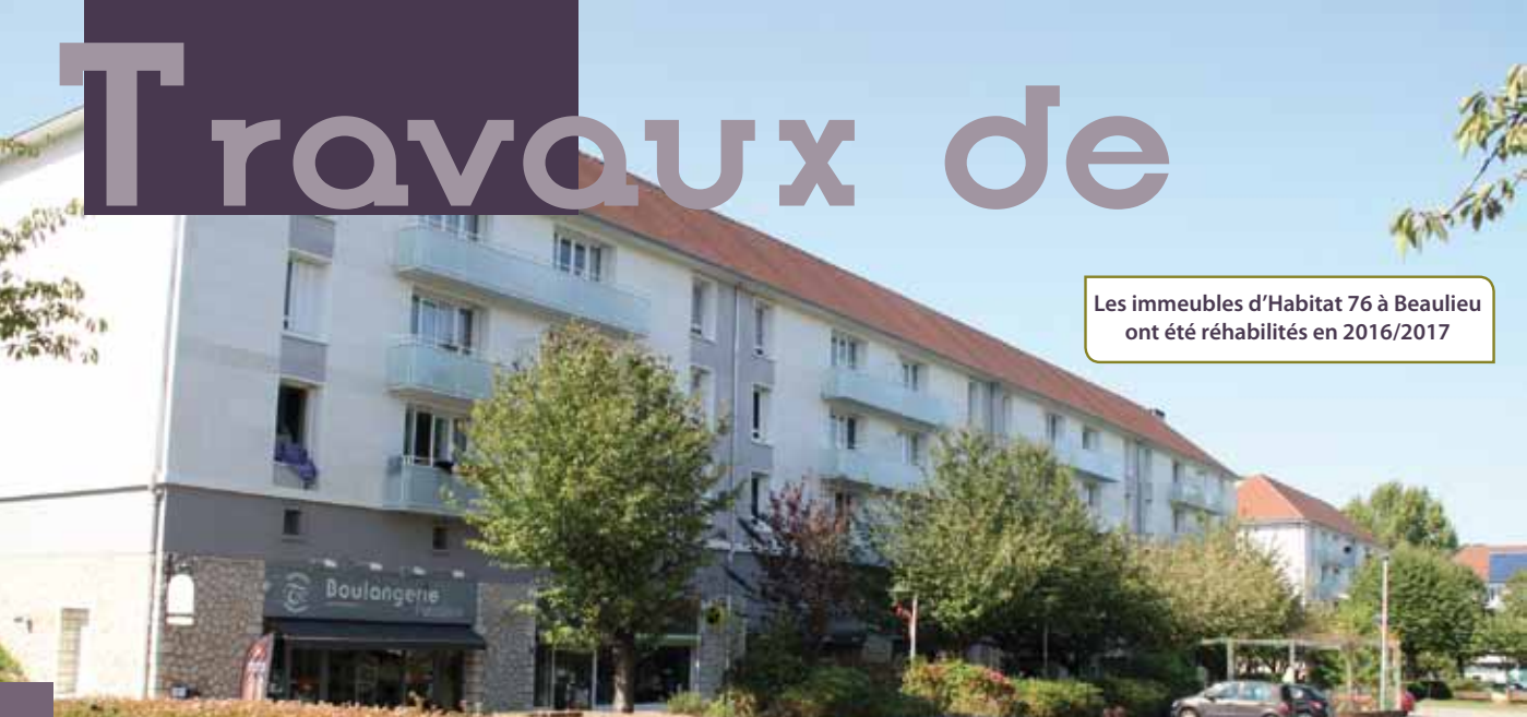
Les immeubles d'Habitat 76 à Beaulieu ont été réhabilités en 2016/2017