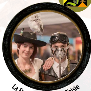
La FantaiScie - Steam Taisie

De 14h30 à 19h > Déambulations artistiques < Centre ancien, parc & La Forge