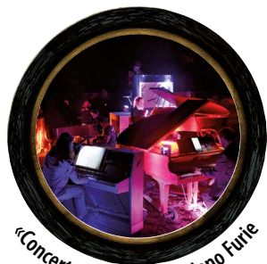
«Concerto à 5 pianos» - Piano Furie

14h30 et 16h30 > «Les Bains de mer» < Scène Braquehais Spectacle par la compagnie Les Pieds au Mur