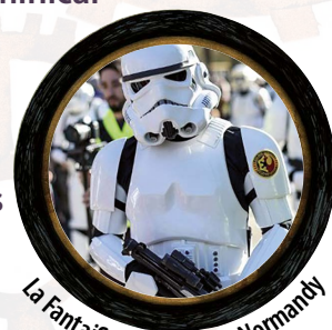
La Fantaisie - Star Wars Normandy

De 10h à 18h > ForgeStock < Mail piétonnier - La Forge Campement aux couleurs hippies