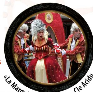
«La Marquise de Noutroy» - Cie Acidu