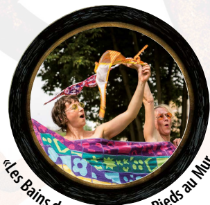
«Les Bains de mer» - Cie Les Pieds au Mur