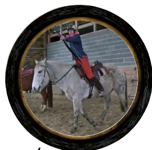
Les Crins de Verdre

De 14h30 à 19h > Déambulations artistiques < Centre ancien, parc & La Forge