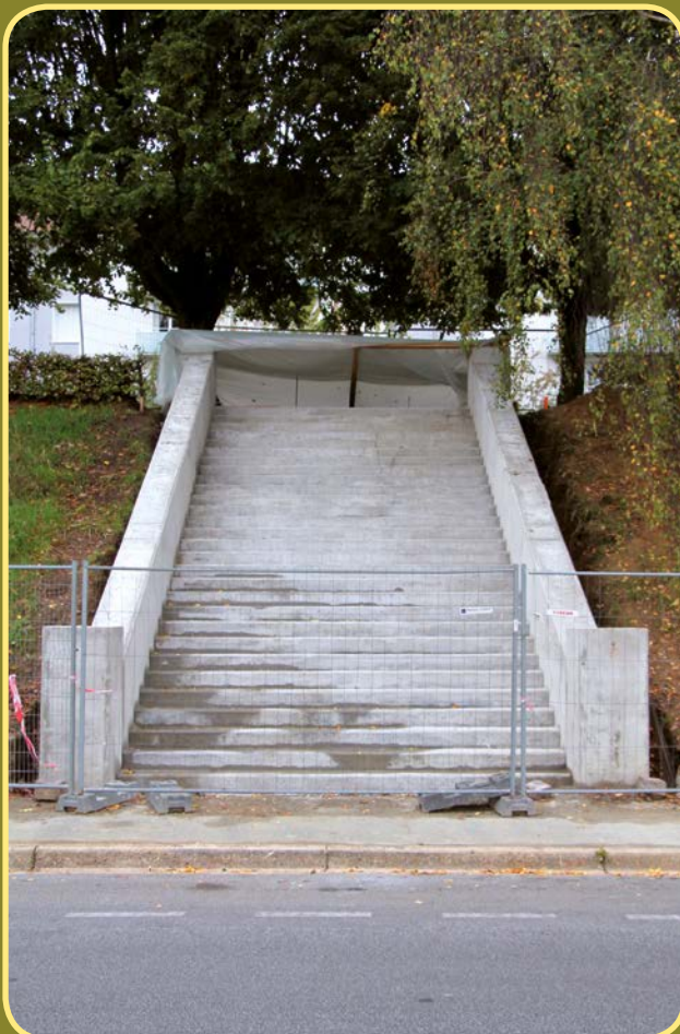
Modèle de guidage vélo sur escalier

Enfin, un abaissement du trottoir (accessible PMR) accompagné d'un nouveau passage piéton viendront dans l'avenir parfaire ce dispositif qui va définitivement permettre au plus grand nombre de profiter de tous les atouts que représente cette place commerçante dotée de savoirs-faire remarquables.