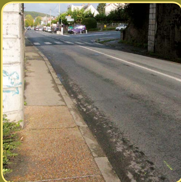
La voûte avant travaux

Le trottoir se rétrécissait à l'aplomb de la voûte créant une proximité entre les piétons et les véhicules, qui au regard des normes actuelles n'était plus acceptable. Sitôt ce constat établi, la décision d'élargir le trottoir à la norme PMR (personnes à mobilité réduite) et de l'équiper d'un garde corps afin de protéger les usagers a été prise et les travaux ont débuté le 23 octobre. Cette date a été choisie de façon à ce que les travaux coïncident avec les vacances scolaires de la Toussaint, permettant ainsi aux élèves du collège Pablo Picasso de ne pas avoir ni à les subir ni à devoir allonger leur trajet pour se rendre en cours.