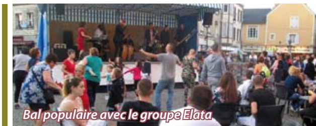
Bal populaire avec le groupe Elata