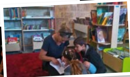
Bibliothèque E. Triolet ▲ Escape game