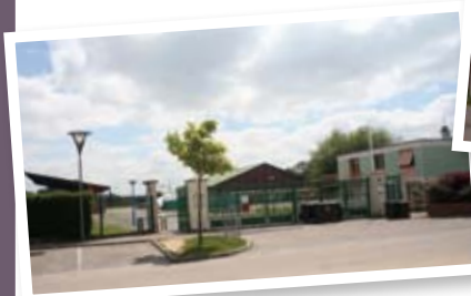
Stade Thorez ▲