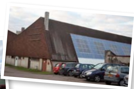
Salle de sport René Cance ▲ (fermée / travaux de rénovation)