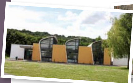
Maison des associations ▲